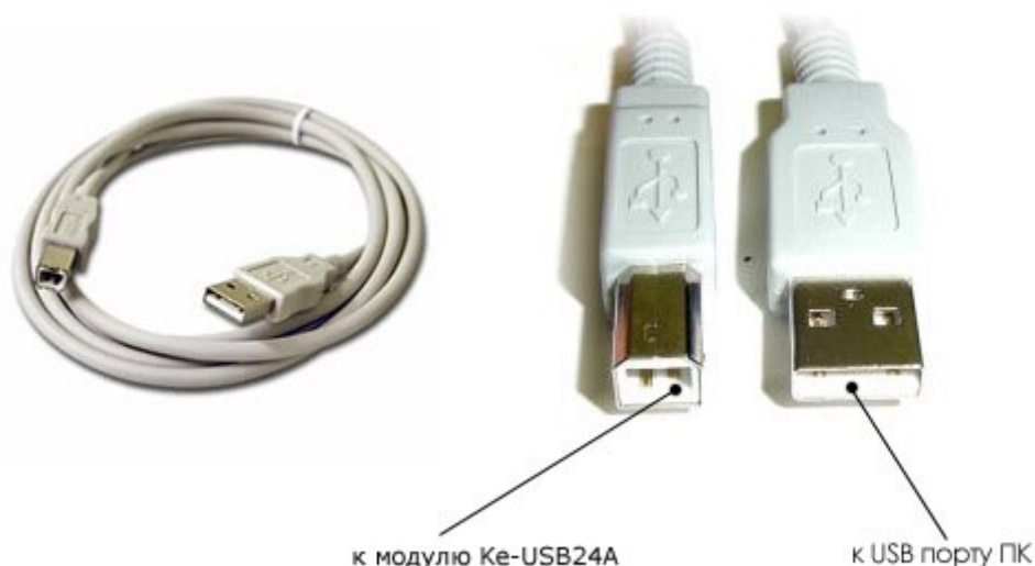
Кабель USB-AB для подключения модуля к компьютеру.

В первую очередь, необходимо подключить модуль к USB порту компьютера. Для этого потребуется кабель USB-AB, показанный на рисунке ниже: